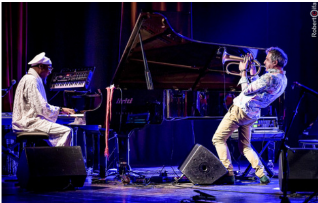
Paolo Fresu i Omar Sosa 10 març - 22h

Concert a la Nova Jazz Cava + nit a l'Hotel Don Cándido ****sup + visita guiada a la Masia Freixa